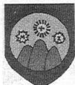
Návrhy znaku Zašové