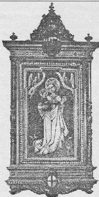
Starý milostný obraz farního a poutního (valašského) kostela v Zašové u Meziříčí n. Bečvou.

Ze vzdáleného Rožnova duchovním potřebám osadníků úplně vyhověno býti nemohlo. Proto již r. 1697 povolání byli řeholníci z řádu trinitářského, aby bydleli v Zašové na dvoře pp. z Žer. Již pak Karel Jindřich z Žer. položil základní kámen pro nový kostel r. 1714, jenž r. 1725 byl posvěcen. Slavně byl tehdy starožitný obraz bl. P. Marie z dřevěného kostelíka hřbitovního sem přenesen. Jest na dřevě malován a představuje rytíře se znakem pánů z Kornic; rytíř klečí před Bohorodičkou jemu se v lese zjevující, v němž čápi se procházejí. Fr. A. hrabě Rotal dal starožitný obraz drahocenným rámem z mědi zlacené a stříbřené zhotoveným opatřiti. Jak Středovský (+ 1713) ve svém spisu "Rubinus Moraviae" vypravuje, byl obraz již dávno hojnými poutníky z daleka široka uctíván, které pouti se pak zvelebovaly. Roku před tím povolil císař Karel VI. i vystavění kláštera pro 13 řeholníků "moravské" řeči znalých, aby vyučovali lid o základních pravdách víry. Na stavby tyto byl otevřen lom na pískovec a tak nový zdroj práce a příjmův obci i lidu dán, z něhož dnes ještě více než tehdy se čerpá. Nejvíce však na kostel a klášter přispěli páni ze Žer., Rud. Podstatský, pán na Lešné, Ant. z Danhausu, pán na St. Jičíně; varhany krásné pořídili svým nákladem M. Jakšík a Petr, bača panský, r. 1743.