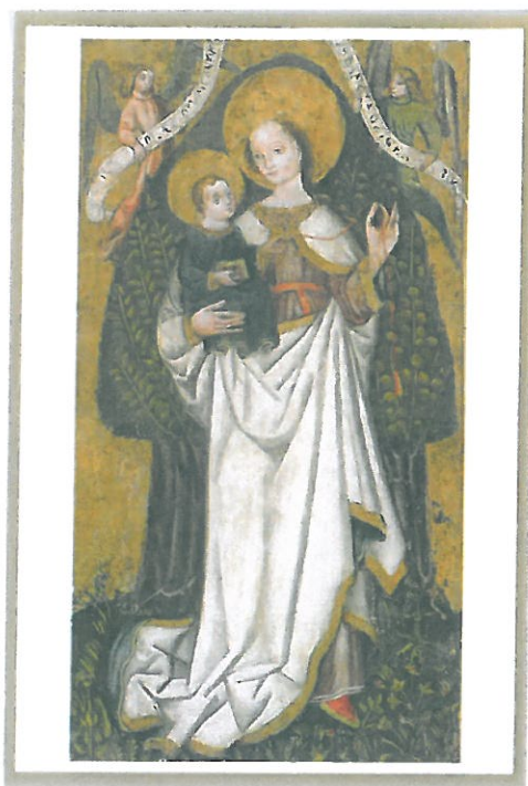
Panna Maria Zašovská Milostný obraz z r. 1475 desková malba