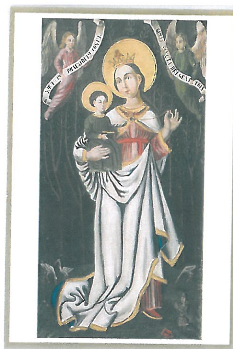
Panna Maria Zašovská lidová přemalba původního gotického obrazu